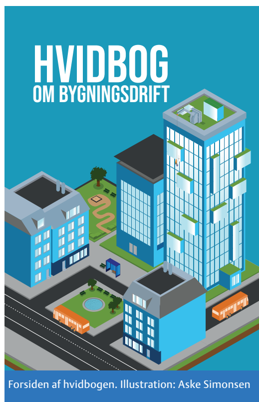
Forsiden af hvidbogen. Illustration: Aske Simonsen

Bygherreforeningen har i regi af branchepartnerskabet udarbejdet en ny hvidbog, der giver et bud på, hvad der er state of the art inden for bygningsdriften i Danmark